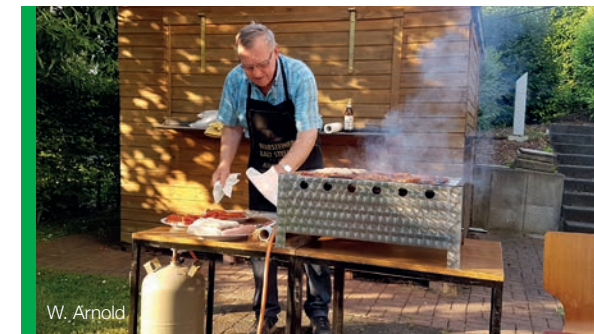
Ein fleißiger Helfer, der zum Ferienbeginn des Kreises „Man(n) trifft sich“, für das leibliche Wohl sorgte.

Am Pfingstmontag fand der Gottesdienst in Herdecke auf dem Vorplatz der katholischen Kirche als ökumenischer Gemeinschaftsgottesdienst statt. Die Gemeindeglieder aus Wetter fuhren mit der MS Friedrich Harkort nach Herdecke. Nach dem Gottesdienst bot sich die Gelegenheit, bei Essen und Trinken mit den Gemeindegliedern der anderen Gemeinden ins Gespräch zu kommen.