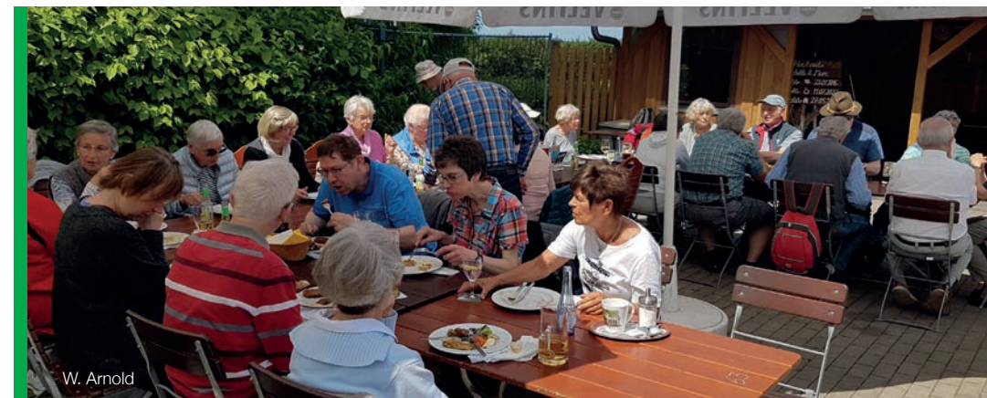
Die Wanderer lassen es sich schmecken.

mittag mit allerlei Köstlichkeiten und kühlen Getränken. Wer nicht wandern wollte, konnte mit dem Auto kommen. Am späten Nachmittag wanderten die Wanderer wieder zurück.